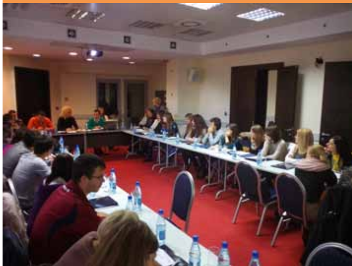
SIGN, okrugli sto na temu fundraising standarda

Na inicijativu Odjeljenja za podršku Nacionalnom savjetu za održivi razvoj (Ministarstvo održivog razvoja i turizma), u aprilu 2012. godine formirana je neformalna Mreža za društvenu odgovornost, koja je u 2013. godini, odlukom Vlade, prerasla u Koordinaciono tijelo za društvenu odgovornost, sa ciljem da promoviše i podstiče koncept društvene odgovornosti u Crnoj Gori. Ovo tijelo okuplja 35 predstavnika vladinih i akademskih institucija, poslovnih asocijacija i organizacija civilnog