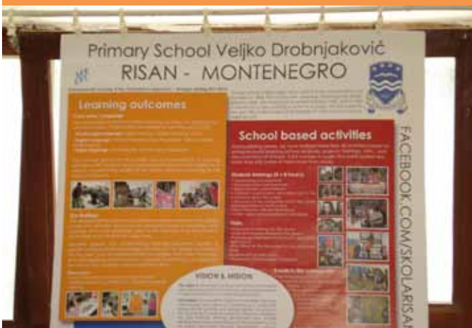
OŠ Veljko Drobniaković, Risna

Poboljšanje održivosti i jačanje uticaja civilnog društva u procesu demokratizacije na zapadnom Balkanu, putem stvaranja povoljnijeg okruženja za razvoj filantropije i davanje za opšte dobro, građanskog aktivizma i međusektorskog dijaloga, glavni je cilj regionalnog projekta "SIGN za održivost". Akademija održivosti, jedna od ključnih komponenti projekta, je program obuke, koji je obuhvatio 15 organizacija civilnog društva iz Crne Gore. Trideset učesnika Akademije, u šestodnevnoj obuci, radili su na vještinama ključnim za obezbjeđivanje njihove održivosti. Tokom trajanja Akademije, učesnici su sticali