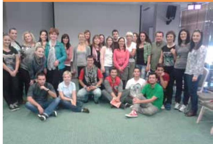
Akademija održivosti, obuka organizacija