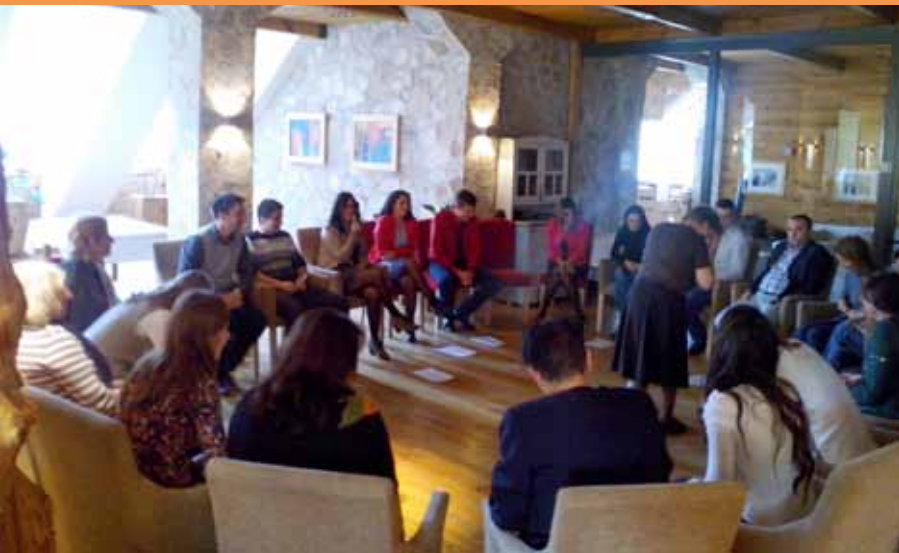
Obuka u okviru programa Inkluzivni klubovi

djeci pogođenoj siromaštvom. Pored komponente finansijske podrške za tri najbolja projekta u cilju osnivanja i razvoja Inkluzivnog kluba, u ukupnom iznosu od 12,000 EUR, program je uključivao i komponentu razvoja uključenih organizacija. Dvadeset članova od deset selektovanih organizacija, prošlo je obuku na temu „Jačanje kapaciteta pružaoca usluga za uspostavljanje i razvoj inkluzivnih