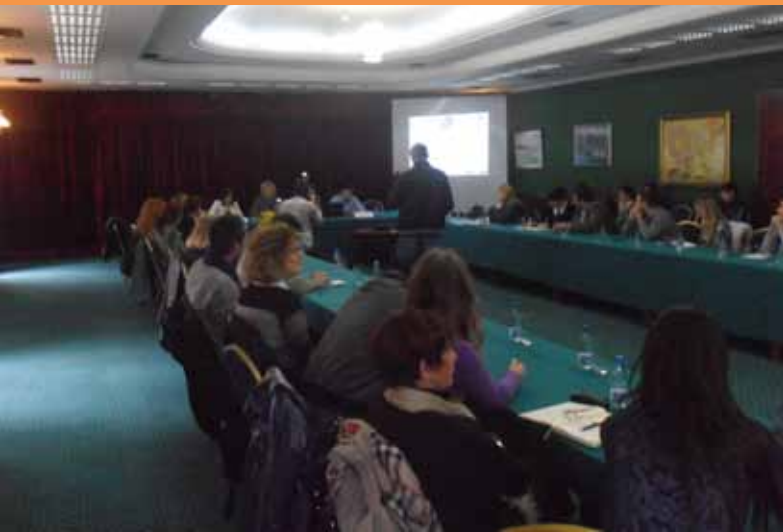
Prezentacija istraživanja rezultata o individualnoj filantropiji

anketiranjem na uzorku od 1000 ispitanika, kako bi dalo reprezentativnu sliku stavova građana Crne Gore. Cilj ovog istraživanja je bio prikupljanja podataka o stavovima građana i mjerenja potencijala za činjenje i davanje za opšte dobro, te praksi koja u tom smislu u Crnoj Gori postoji. Neki od glavnih nalaza su: