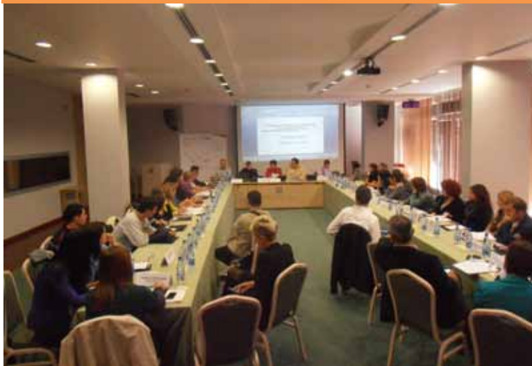
Okrugli sto - Poreski propisi od značaja za razvoj filantropije