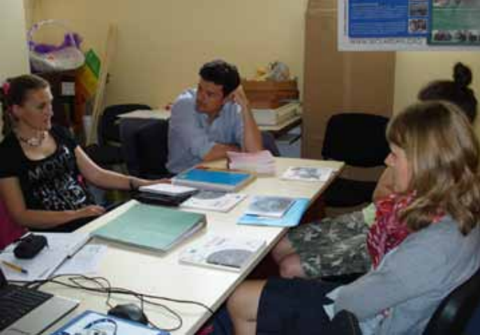
Učenički parlament škole u Risnu

društva kroz grant program -podrška inicijativama javnog zastupanja koje daju glas za nedovoljno zastupljene grupe i podrška OGD pružaocima socijalnih usluga u oblastima poboljšanja kvaliteta usluga i javnog zastupanja za poboljšanje pravnog okvira za njihov rad ( kroz grant program), grant program u iznosu od 5.000 - 10.000 € po svakoj OGD za razvoj njihovih usluga . Ukupno za grantove će biti opredjeljeno 110.000 €.