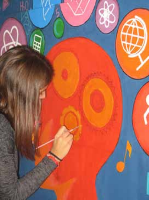
Oslikavanje zida škole