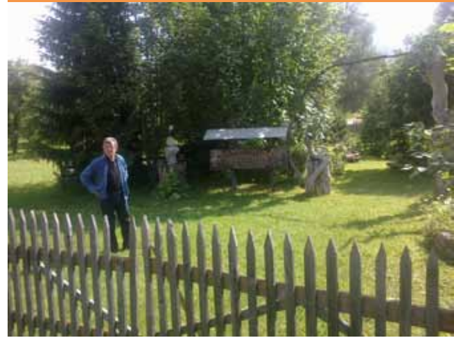
Botanička bašta Velemun