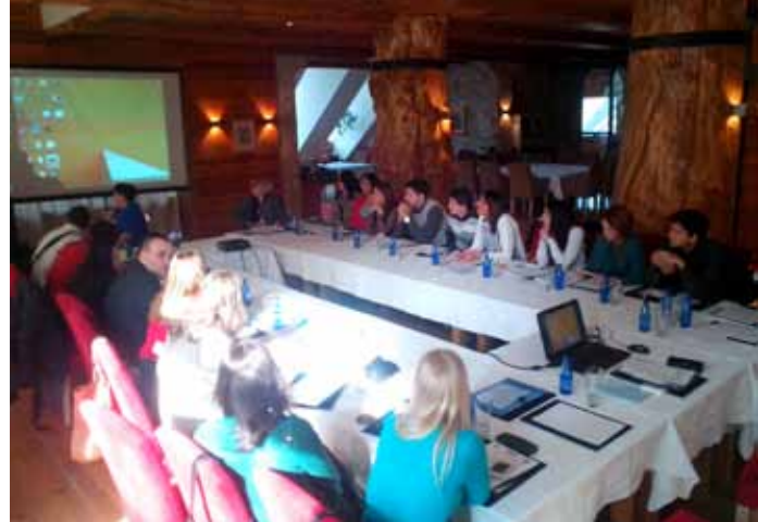
Trening, uspostavljanje Inkluzivnog kluba

b) Finansijska podrška za organizacije civilnog