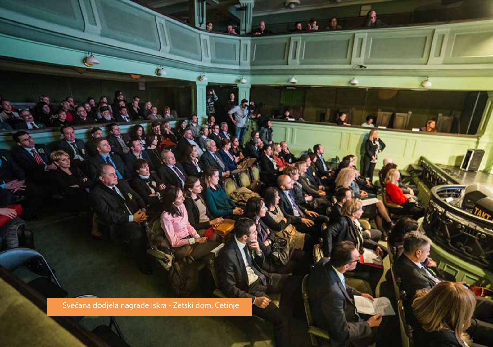
Svečana dodjela nagrade Iskra - Zetski dom, Cetinje