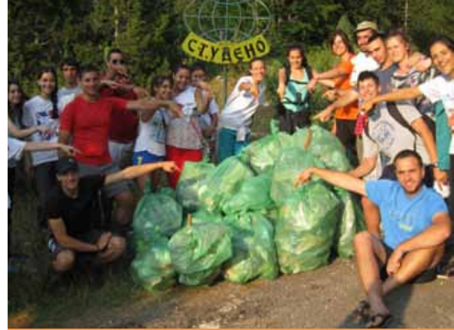
NVO 9. decembar