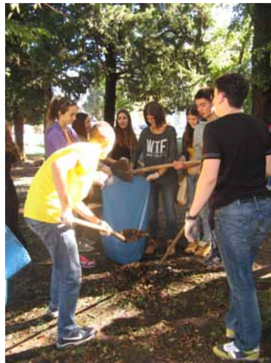
Čišćenje dvorišta škole