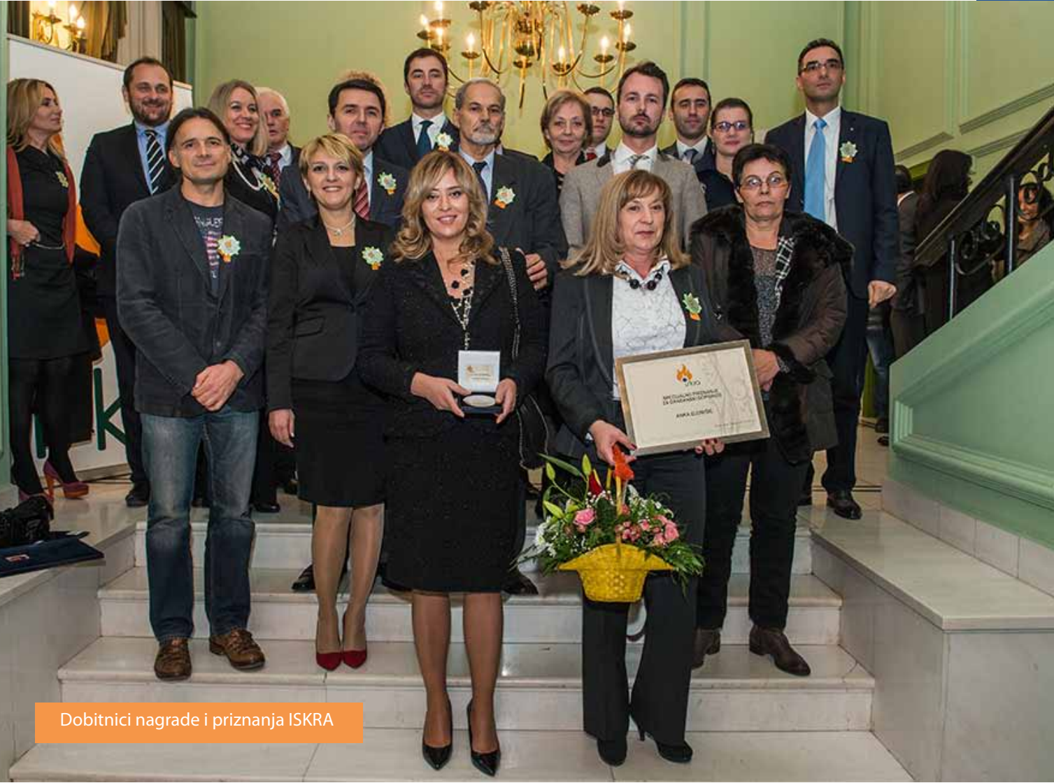
Dobitnici nagrade i priznanja ISKRA