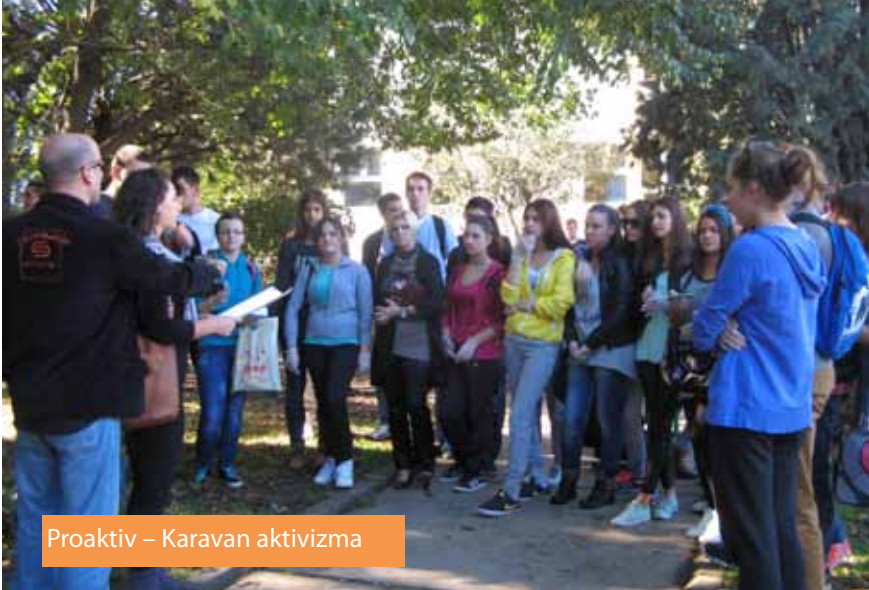
Proaktiv – Karavan aktivizma