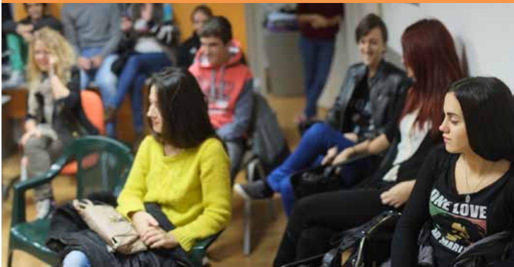
Otvaranje kutka za mlade

Tokom 2013 godine, na adresu fAKT-a, ukupno je