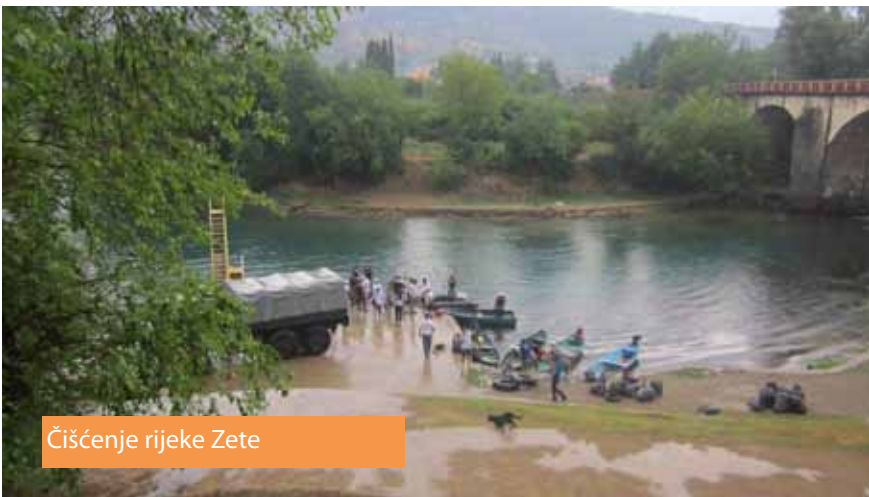
Čišćenje rijeke Zete